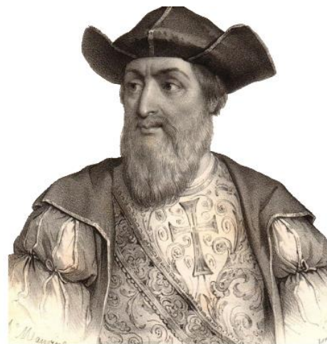
Васко да Гама